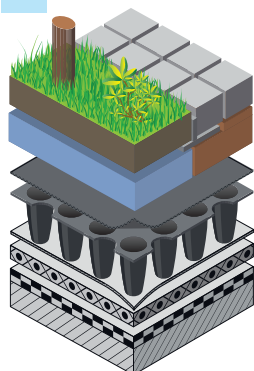
Opbouw Nophadrain Extensief (1) en Intensief (2) Groendaksysteem