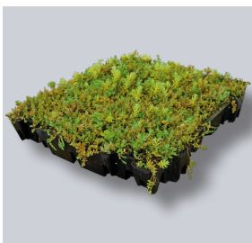
ND Sedumcassette - Premium

Met de ND Sedumcassettes - Premium is het mogelijk om in één handeling een extensief groendak te realiseren. De cassettes hebben afmetingen van 460 x 495 mm x 80 mm. De cassettes combineren de drainagelaag, waterbufferingslaag, filterlaag, substraatlaag en vegetatielaag in één eenvoudig product. Hierdoor is het niet nodig om substraat en vegetatie apart aan te brengen. De cassettes zijn zo ontworpen dat ze snel en eenvoudig strak aan elkaar kunnen worden bevestigd op de wortelwerende dakafdichting, die beschermd wordt door een beschermlaag zoals het ND SV-300 Beschermvlies.