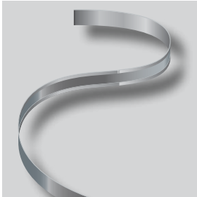
ND GARDLINER® StaalLight

Een duurzaam en buigbaar metalen kantopsluitingssysteem met een hoogte van 110 mm als blijvende afgrenzing tussen beplante en vegetatievrije zones / verhardingen in een tuin of park. Door de bijgeleverde perkverhogingselementen is dit profiel tevens te gebruiken als perkverhoger en toepasbaar op het groendak.