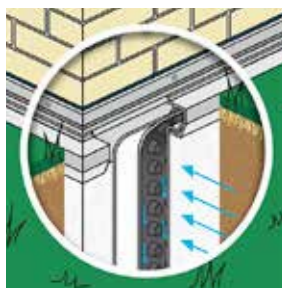
ND "Clic" Grundmauer Drain- und Schutzsystem

Das ND 100 Drainagesystem ist eine Komponente des ND "Clic" Grundmauer Drain- und Schutzsystems als Filter-, Drain- und Schutzschicht geeignet für Grundmauer ohne KMD Abdichtung.