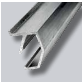
ND „Clic“ System-Frontprofil