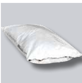
Substrat in Säcke