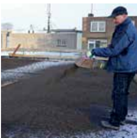
Gebblasen (Silo Lkw)

* Forschungsgesellschaft Landschaftsentwicklung Landschaftsbau e.V. - www.fll.de