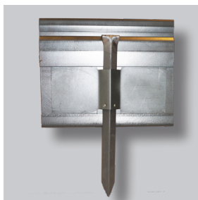
ND GARDLINER® StahlLight 160V