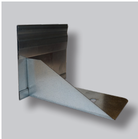
ND GARDLINER® StahlLight 160VH

Mit dem GARDLINER® StahlLight 160VH können leicht und schnell Beeterhöhungen kreiert werden. Die StahlLight-Randeinfassungsprofile werden mit Beeterhöhungselementen geliefert, die zugleich die Profile miteinander verbinden. Die GARDLINER® StahlLight VH-Typen werden mit den mitgelieferten Erdnägeln unsichtbar im Erdboden befestigt. Die StahlLight-VH-Randeinfassungssysteme können auch auf Gründächern angewendet werden. In diesem Fall werden die Erdnägeln nicht verwendet.