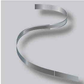
ND GARDLINER® StahlLight

GARDLINER® StahlLight ist ein aus verzinktem Stahlblech gefertigtes Randeinfassungssystem. Ein einzelnes StahlLight-Paket beinhaltet 20 lfm. Die Profile sind in den Höhen 110, 160 und 210 mm erhältlich und sie bilden eine dauerhafte Abgrenzung zwischen Bepflanzungen und wassergebundene Wege. Die 0,9 mm dicken Profile sind leicht zu biegen, wodurch gerade Linien und geschwungene Kurven einfach zu gestalten sind. Die Profile sind an der Ober- und Unterseite mit einem 3 mm breiten Falz versehen.