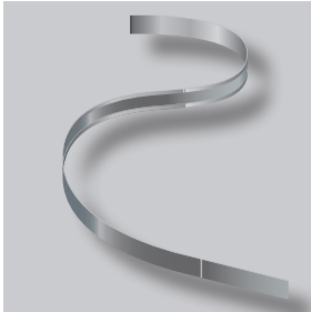
ND GARDLINER® StahlLight

GARDLINER® StahlLight ist ein aus verzinktem Stahlblech gefertigtes Randeinfassungssystem. Ein einzelnes StahlLight-Paket beinhaltet 20 lfm. Die Profile sind in den Höhen 110, 160 und 210 mm erhältlich und sie bilden eine dauerhafte Abgrenzung zwischen Bepflanzungen und wassergebundene Wege. Die 0,9 mm dicken Profile sind leicht zu biegen, wodurch gerade Linien und geschwungene Kurven einfach zu gestalten sind. Die Profile sind an der Ober- und Unterseite mit einem 3 mm breiten Falz versehen.