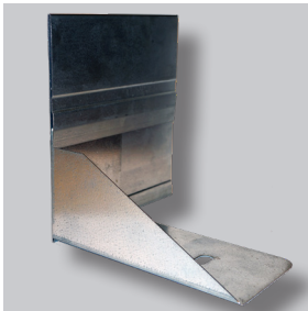
ND GARDLINER® StahlLight 210VH

Mit dem GARDLINER® StahlLight 210VH können leicht und schnell Beeterhöhungen kreiert werden. Die StahlLight-Randeinfassungsprofile werden mit Beeterhöhungselementen geliefert, die zugleich die Profile miteinander verbinden. Die GARDLINER® StahlLight VH-Typen werden mit den mitgelieferten Erdnägeln unsichtbar im Erdboden befestigt. Die StahlLight-VH-Randeinfassungssysteme können auch auf Gründächern angewendet werden. In diesem Fall werden die Erdnägeln nicht verwendet.