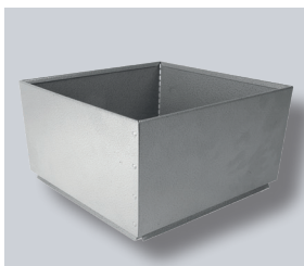
ND RS-8-V10 Aufstockelement